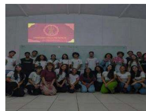
Figura 4. Registro de uma das rodas de leitura.

Com uma história fundamentada no patriarcado, o mundo, em que “Pela maior parte da História, ‘anônimo’ foi uma mulher” (WOOLF, 2014), exige a reflexão entre os jovens, que são o retrato do futuro da nação e do planeta, a respeito do papel da mulher na sociedade. Os discentes do IFMS puderam, por meio deste projeto atuar como consumidores de obras, até então pouco divulgadas, apropriar-se delas e, a partir disso, protagonizarem suas histórias, produzindo textos que elencaram uma obra literária: um livro que traz suas reflexões, percepções e leituras sobre essa temática tão relevante. Por isso, vale salientar que, os estudantes não apenas resgataram autoras apagadas no cânone, mas foram, eles mesmos, autores e responsáveis por tal resgate, gravando eternamente seus nomes como autores, produtores e senhores de suas histórias.