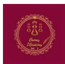
Figura 1. Logo do projeto.